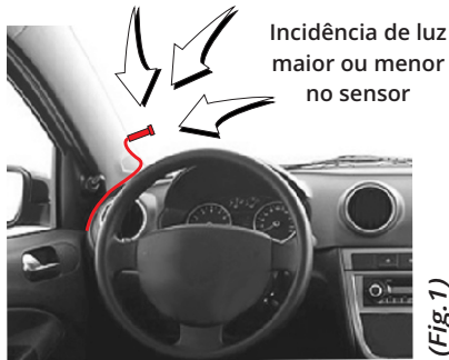
Incidência de luz maior ou menor no sensor